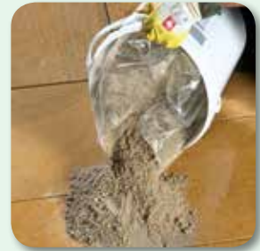
Mörtel portionsweise aufbringen