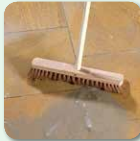
letzte Mörtelreste ggf. mit Kokosbesen entfernen