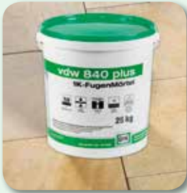
Fläche rückstandsfrei reinigen