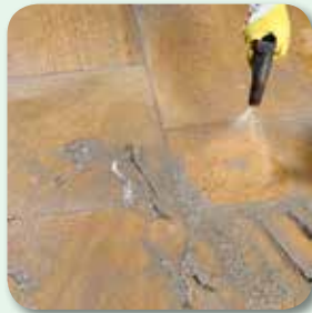
Oberfläche mit weichem Wassersprühstrahl reinigen