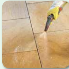
Fläche satt vornässen