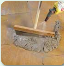
Mörtel mit Hartgummischieber und Wassersprühstrahl einarbeiten